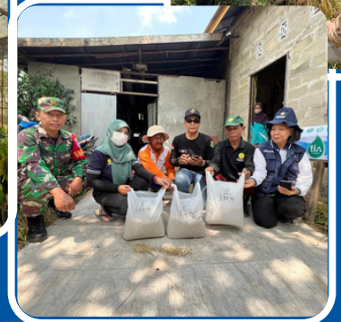
PEMERIKSAAN KINERJA ATAS EFEKTIVITAS UPAYA PEMERINTAH DAERAH DALAM PENGEMBANGAN SEKTOR UNGGULAN UNTUK KOMODITAS JAGUNG

PENYUSUN REDAKSI: SUBBAGIAN HUMAS DAN TU KALAN BPK PERWAKILAN PROVINSI KALIMANTAN TENGAH