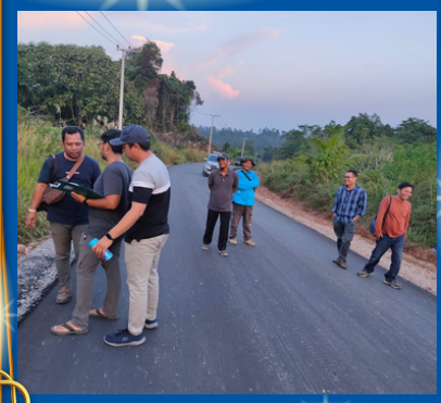
PEMERIKSAAN KEPATUHAN ATAS BELANJA DAERAH