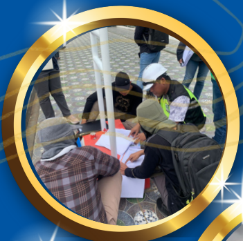
PEMERIKSAAN KEPATUHAN ATAS BELANJA DAERAH