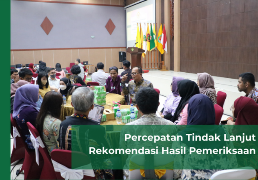
Percepatan Tindak Lanjut Rekomendasi Hasil Pemeriksaan