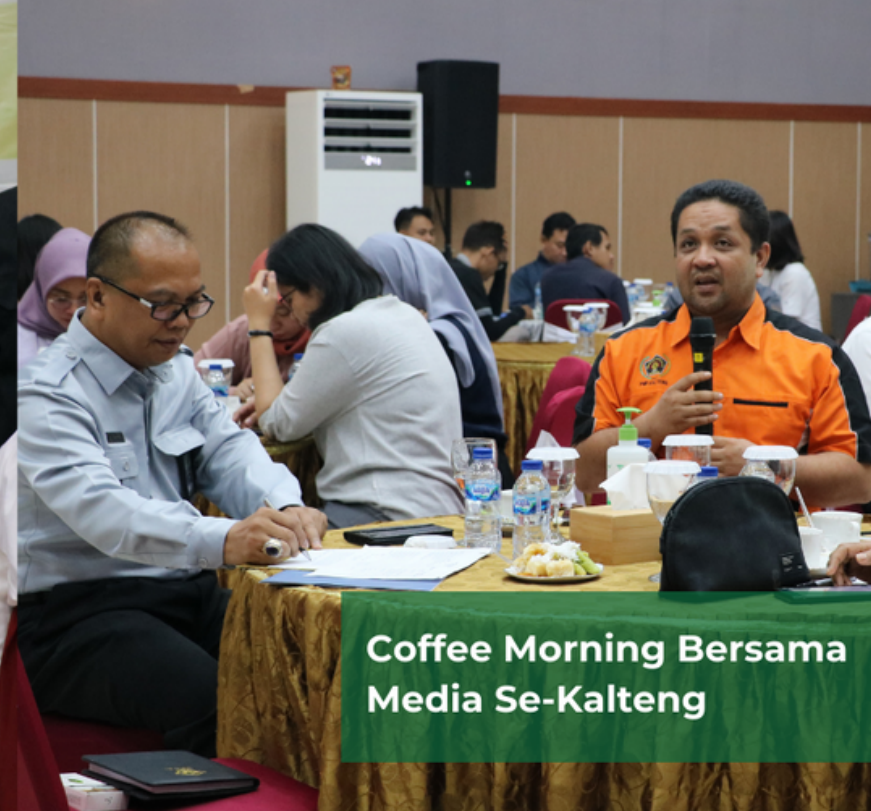
Coffee Morning Bersama Media Se-Kalteng