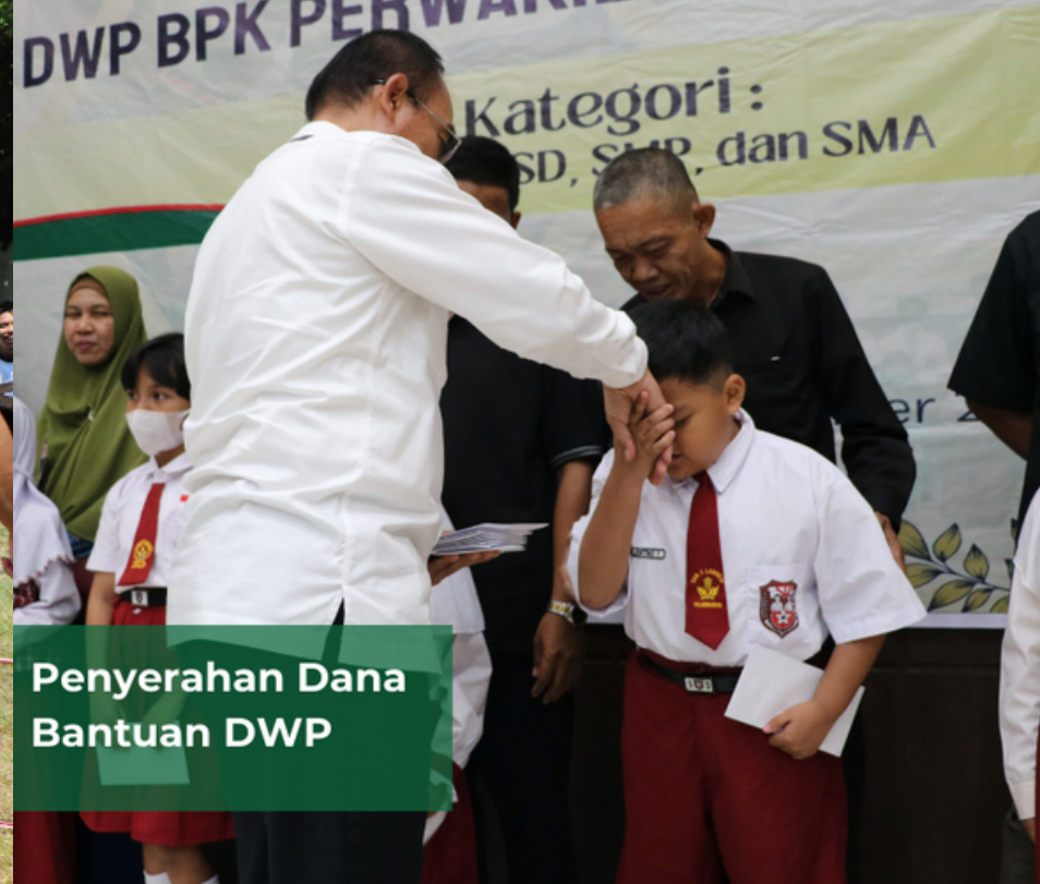
Penyerahan Dana Bantuan DWP