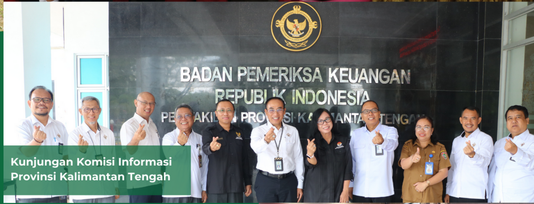
Kunjungan Komisi Informasi Provinsi Kalimantan Tengah