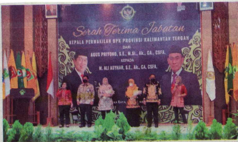
SERTIJAB- Suasana Sertijab Kepala Perwakilan BPK Provinsi Kalteng di Palangka Raya, Rabu (21/9).

"Keberadaan BPK di setiap provinsi diharapkan semakin mendekatkan objek pemeriksaan dengan kewenangan untuk melakukan pemeriksaan pengelo-