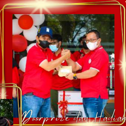
Doorprize dan Hadiah